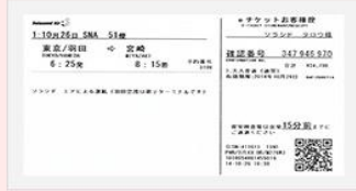
eチケットお客様控

※ご予約・ご購入方法によって必要な2次元バーコードをお一人様につき1つお持ちください。