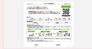
ホームページから印刷したeチケット控