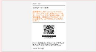
携帯電話で取得した2次元バーコード