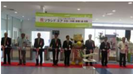
南ぬ島石垣空港での就航記念行事の様子