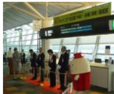
中部国際空港での就航記念行事の様子