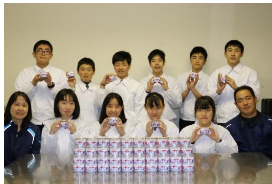
「伊佐農林高等学校 食品加工コースの生徒さん」