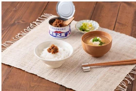
「更生之素」イメージ

鹿児島県伊佐市にある伊佐農林高等学校で昭和 7 年から受け継がれ、同校生徒が授業の一環として製造・販売を行う地元の味です。校内で育てた黒豚やショウガと、3 ヶ月かけて仕込んだ麦みそを使用し丁寧に手作業で作り上げた『更生之素』を数量限定で機内販売します。