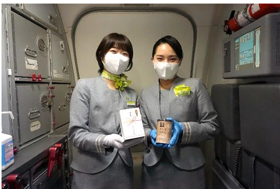
“栗のトップブランド” 宮崎県小林市須木産の「須木栗」を使用