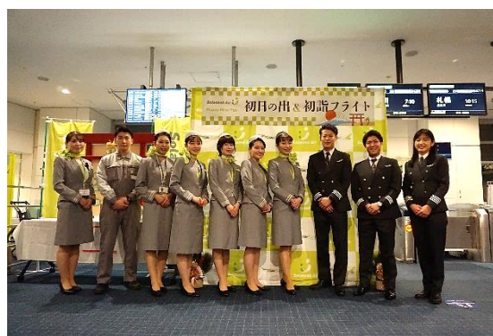
当日のクルー(運航乗務員・客室乗務員)と 空港旅客係員・整備士が集合！