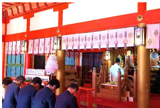
青島神社での特別参拝