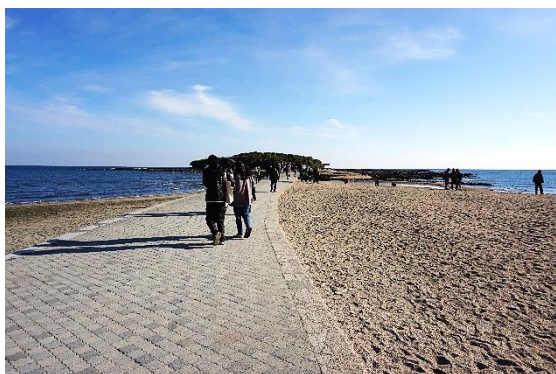
晴天に恵まれた青島

毎年人気の高い宮崎・青島神社の初詣へご案内。今年も天候に恵まれ、快晴！バスの車窓からは堀切峠の絶景を觀賞、青島では青島神社参拝や宮交ボタニックガーデン青島の散策、お土産のショッピングをお楽しみいただきました。昼食は、ホテル「ANA ホリデイ・イン リゾート宮崎」で、宮崎県の特産や名物のお正月こだわりメニューに舌鼓♪