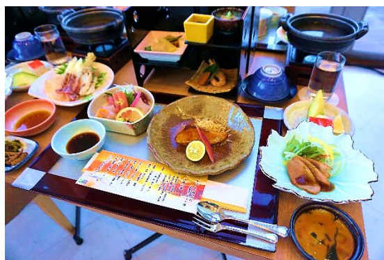
宮崎県産食材を使った昼食