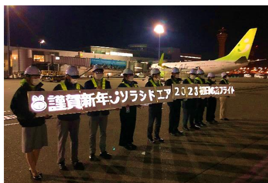
寒空の下、ソラシドエア整備士手作りの LED 電光掲示板でお見送り