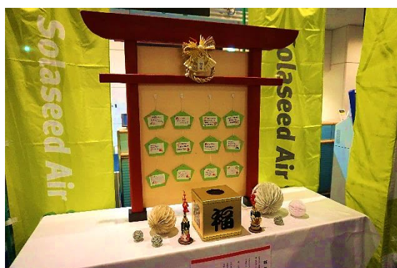
搭乗ゲート前にソラシドエア社員手作りの おみくじスポットが登場！