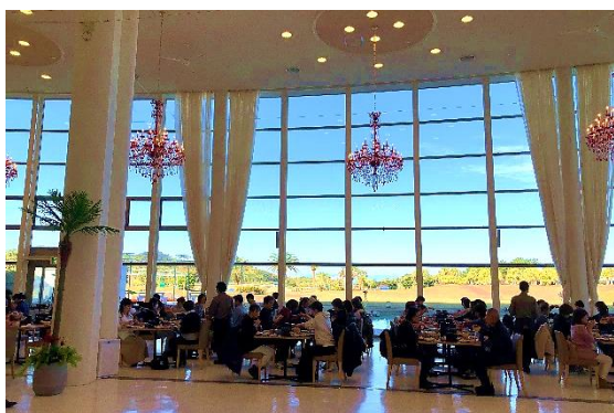
昼食会場(ANA ホリデイ・イン リゾート宮崎)