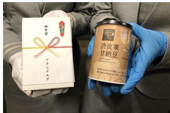
お正月特別パッケージで配付しました