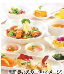
黒酢ランチの一例(イメージ)

④ 鹿児島県霧島市福山町福山字大田311-2 ☎ 0995-55-3231 ⑤ 0995-55-3231 ⑥ 11:00~15:00(ラストオーダー15:00) ⑦ 現地販売価格:1,620円 (お子様ランチの場合は1,000円) ⑧ メン料理5種のうちからチョイス、季節の食前酢、前菜、有機野菜サラダ、小鉢、ライスまたはパン、黒酢スープ、コーヒー&黒酢スイーツ ⑨ 受付時係員 ※10歳以下のお子様は、お子様ランチとなります。