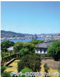
グラバー園の景観(イメージ)