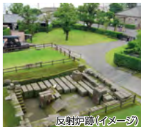
反射炉跡(イメージ)