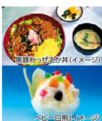
黒豚わっぜえか丼(イメージ)

④ 鹿児島県鹿児島市千日町5-8 天文館むじやきビル4階 ☎ 099-222-6904 ⑤ 不定休 ⑥ 11:00~15:00(ラストオーダー14:30) 17:00~22:00(ラストオーダー21:30) ⑦ 現地販売価格:1,500円 ⑧ 黒豚わっぜえか丼、薩摩汁、香の物、ベビー白熊(ミニかき氷) ⑨ 受付時係員 ※4階フロア限定のご利用となります。