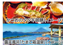
かつおのタタキ御膳(イメージ)