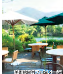
美術館内カフェ(イメージ)