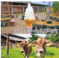
ソフトクリーム(イメージ)

④ 熊本県阿蘇郡西原村河原3944-1 ☎ 096-292-2100 ⑤ 10:00~17:00(最終受付16:30) ⑥ 現地販売価格: 入場 3歳以上 350円、ソフトクリーム 300円 ⑦ 阿蘇ミルク牧場入場+ソフトクリーム ⑧ 入場窓口係員