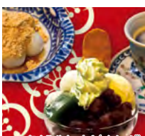
あまみやセットA(イメージ)

④ 熊本県熊本市東区上通4-16 9(2F)2階 ☎ 096-323-1136 ⑤ 月曜日 11:30~18:00(ラストオーダー17:30)、日・木曜日祝日 11:30~22:00(ラストオーダー21:30)、金土・祝前日 11:30~23:00(ラストオーダー22:30) ⑥ 現地販売価格:680円 ⑦ A:チビ白玉パフェ、白玉きなごだんご、ドリンク B:ミニ抹茶ぜんざい、ミニトウモロコシゼリー、ミニアイス、ドリンク C:季節のオリジナルケーキ、ミニあんみつ、ドリンク ⑧ 注文時係員 ※事前予約は受けておりません。 ※土、日・祝日はお並びいただく場合がありますので、あらかじめご了承ください。 ※ドリンクはコーヒーまたは紅茶または緑茶またはソフトドリンクとなります。