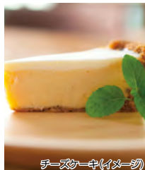
チーズケーキ(イメージ)