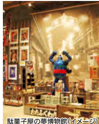
駄菓子屋の夢博物館(イメージ)