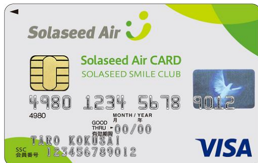
<Solaseed Air カード（クラシック）>