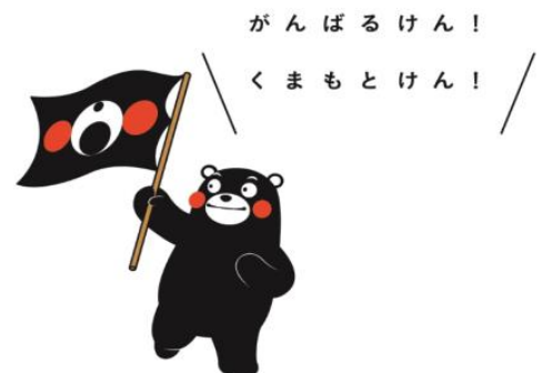
<くまモン復興シンボルマーク>

この復興支援機では、熊本県が新たに掲げる復興を誓うシンボルマークを採用しました。機体の前方入口には、復興の旗振り役を務めるくまモンが、「心をひとつに頑張ろう！」と呼びかける姿が描かれお客様をお迎えます。機体中央には、にっこり笑顔のくまモンが大きく描かれ、ソラシドエアが就航する全路線を飛び回ります。機内では、熊本県の情報誌の搭載※や客室乗務員がオリジナルエプロンを着用し機内サービスを実施するとともに、各地でのPRイベントに熊本県と共同参加する等、共に活動を行ってまいります。