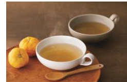
「アゴユズスープ」 イメージ