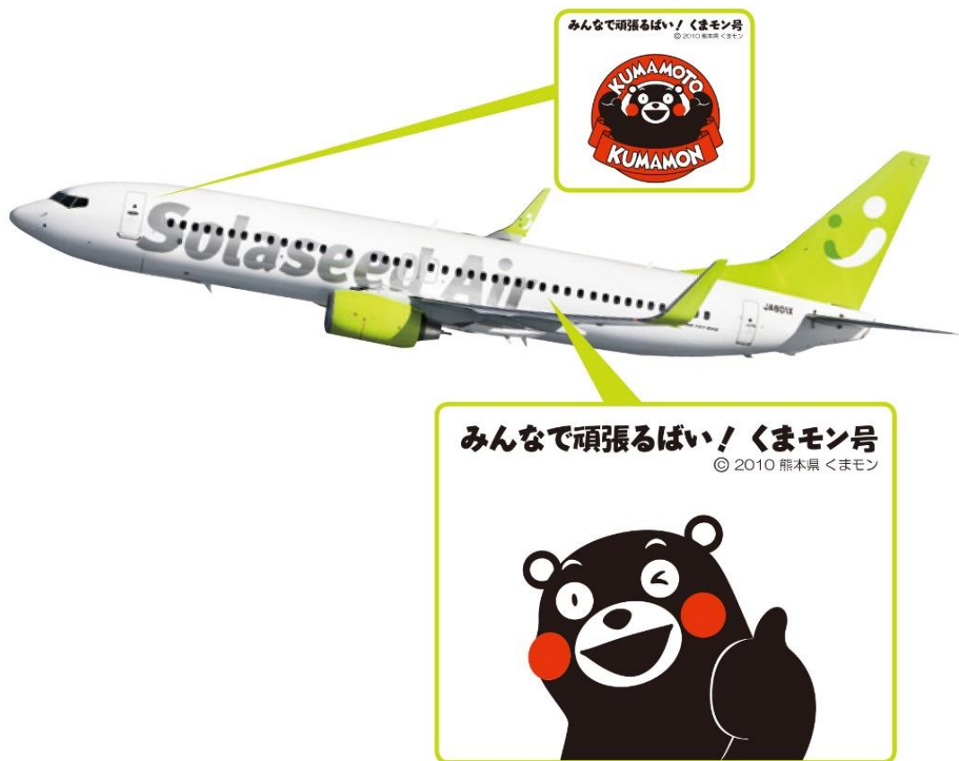
<機体デザインイメージ>