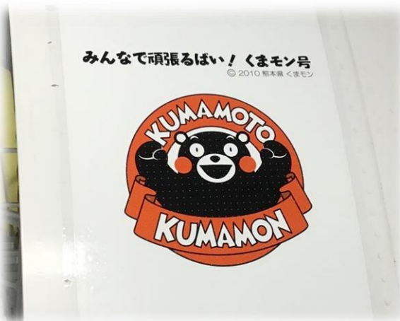
搭乗口前方 機体ステッカー (サイズ:H300mm×W300mm)