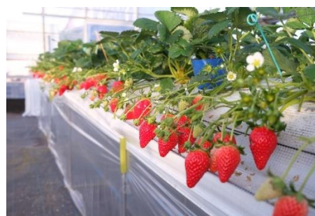
いちご狩り(画像はイメージです)