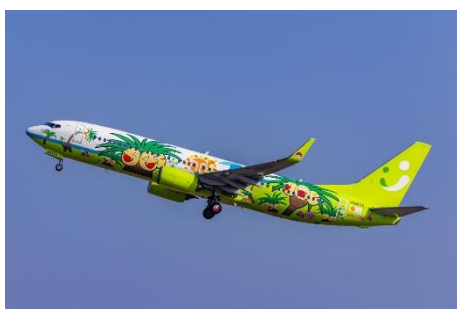
ナッシージェット宮崎

本ツアーは宮崎を代表する観光地・青島地区や、イースター島から許可を受け再現されたモアイ像があるサンメッセ日南などを観光します。また、いちご狩り体験やいちごを使ったオリジナルスイーツ作り体験などもご用意しました。ぜひこの機会に、家族で宮崎旅をお楽しみください。