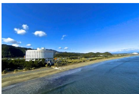
ANA ホリデイ・イン リゾート宮崎(宿泊ホテル)