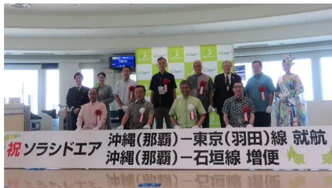
< 就航セレモニーの様子(那覇空港) >

ソラシドエアは、「九州・沖縄」にこだわった機内環境作りや機内サービス等をご用意しています。お客様が温かく・明るく・元気な「笑顔」でお過ごしいただけるよう、社員一同努めてまいります。