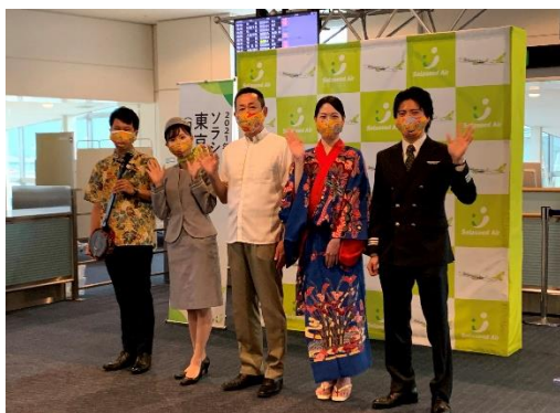
< 就航セレモニーの様子(羽田空港) >

東京(羽田)-沖縄(那覇)線は、念願の定期便通期運航となります。これまで、2016 年から臨時便として設定し、運航実績を積んでまいりました。中長期的に航空需要の変化への対応として、当路線は当社にとって必要な基盤路線になっていくと考えております。