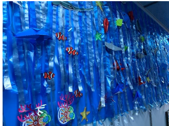
<「海中トンネル」(羽田空港)>