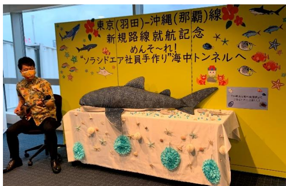
<「三線演奏」(羽田空港)>