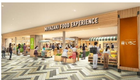
「みやざきフードエクスペリエンス(仮称)」イメージ

いちごおよびソラシドエアは、これらの取り組みを通じ、宮崎県や神奈川県等の農水産業等の持続可能性を高め、地域の活性化に貢献してまいります。