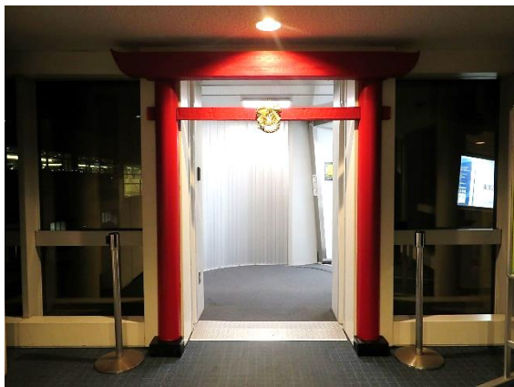
社員が想いを込めて制作した手作りの鳥居