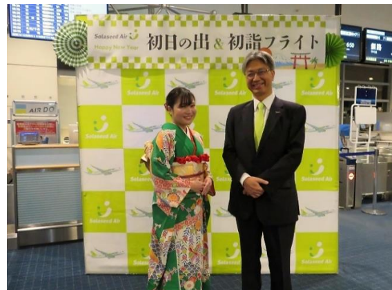
セレモニーの様子