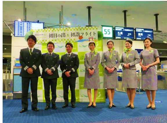
乗務員 7 名で、元旦テイクオフ！