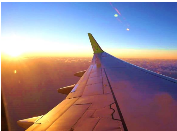
機内から見る 初日の出

明けましておめでとうございます。2022 年元旦の早朝より大変多くのお客様に「初日の出&初詣フライト」にご搭乗頂き、ありがとうございます。当社のフライトは、初日の出周遊のみでなく、当社の地元宮崎の観光(青島神社初詣など)を組み合わせ、「人と地域を繋ぐ」ことに重きをおいております。お客様に 2022 年のお正月を楽しんで頂けるよう、全社を挙げて試行錯誤しながら企画してまいりました。九州・沖縄に行ってみたい・応援したい、そのような出会いのきっかけ作りになれば幸いです。当社は本年就航 20 周年を迎えますが、地元と共にコロナ禍からの復活の年にすべく尽力してまいります。ぜひ、九州・沖縄の新しい出会いを探しに、ソラシドエアでお出かけください。本年もどうぞよろしくお願ひ致します。