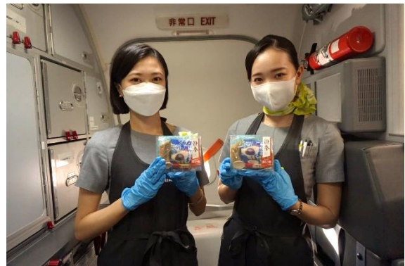
祈願済み赤い糸入り「縁結びのしずく®ブルーハーブ味」を機内で配付しました