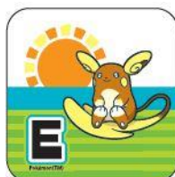
(E) アローラライチュウ