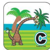
(C) アローラナッシー