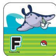
(F) テッポウオ・マウンテン