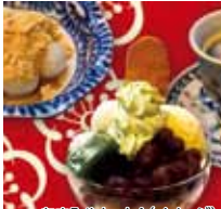
あまみやセットA(イメージ)