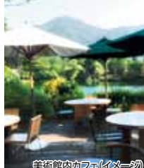
美術館内カフェ(イメージ)

湯布院の金鱗湖に建つ美術館。美しい景色を背景にアート・カフェ・ショッピングをお楽しみください。