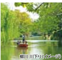
柳川 川下り(イメージ)