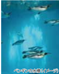
ペンギンの水槽(イメージ)

地球上に生息する18種類のペンギンのうち9種類約180羽を飼育。大きな水槽の中を悠々と泳ぐ愛らしいペンギンの姿を間近で見学いただけます。