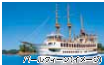
パールウィーン(イメージ)

「パールウィーン」または「みらい」にご乗船いただき、約50分の南九十九島遊覧をお楽しみください。