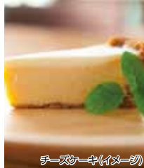
チーズケーキ(イメージ)

濃厚で香り豊かなアールグレイのチーズケーキまたはB-speakのPロールをご堪能ください。