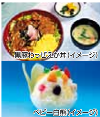
黒豚わっぜえか丼(イメージ)