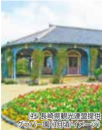
(注)長崎県観光連盟提供 グラバー園(8月頃)(イメージ)

長崎の美しい景色を眺望できる高台に、趣の異なる9棟の洋館が建ち並び長崎随一の観光名所。