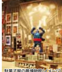
駄菓子屋の夢博物館(イメージ)

「駄菓子屋の夢博物館」・「昭和の夢町三丁目館」・「チームラボギャラリー-昭和の町」の3館共通入館券です。