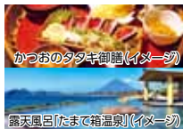
露天風呂「たまで箱温泉」(イメージ)