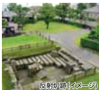
反射炉跡(イメージ)