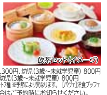
飲茶セット(イメージ)