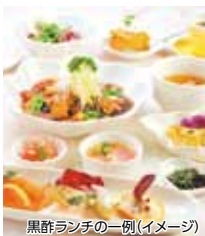
黒酢ランチの一例(イメージ)