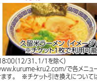
久留米ラーメン(イメージ) ※チケット1枚で利用可能