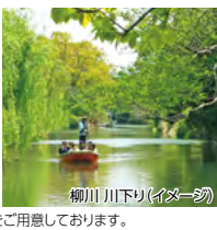
柳川 川下り(イメージ)