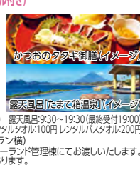
かつおのタタキ御膳(イメージ)