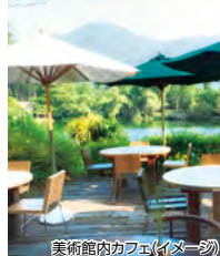
美術館内カフェ(イメージ)