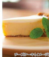
チーズケーキ(イメージ)