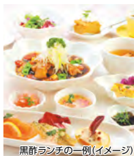
黒酢ランチの一例(イメージ)