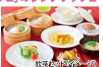
飲茶セット(イメージ)

[パヴェ]月~金曜日 大人 1,900円、小学生 1,300円、幼児(3歳~未就学児童) 800円 土・日・祝日 大人 2,500円、小学生 1,600円、幼児(3歳~未就学児童) 800円 ⑨[潤慶]サラダ、スープ、海鮮、蒸し餃子、炒飯またはお粥、デザート2種 ※季節により異なります。 [パヴェ]洋食buffet ⑩レストラン係員 ※お子様がいらっしゃる場合はご予約時にお知らせください。