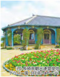
(グラバー園(3月頃)イメージ)