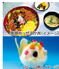
黒豚わっぜえか丼(イメージ)