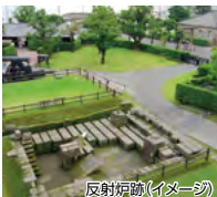
反射炉跡(イメージ)